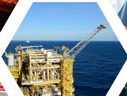
Petrochemicals Hóa dầu