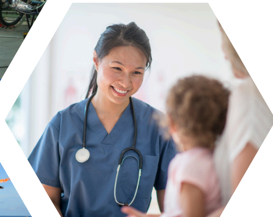
Healthcare | Y tế