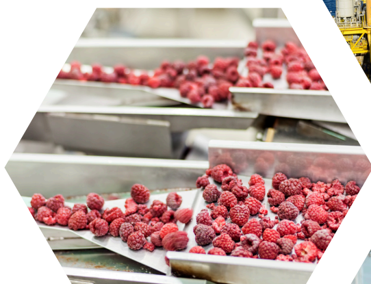
Food & Pharmaceuticals Thực phẩm & Dược phẩm