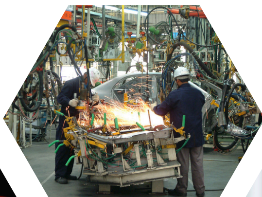
Automotive Industry Sản xuất Ô tô