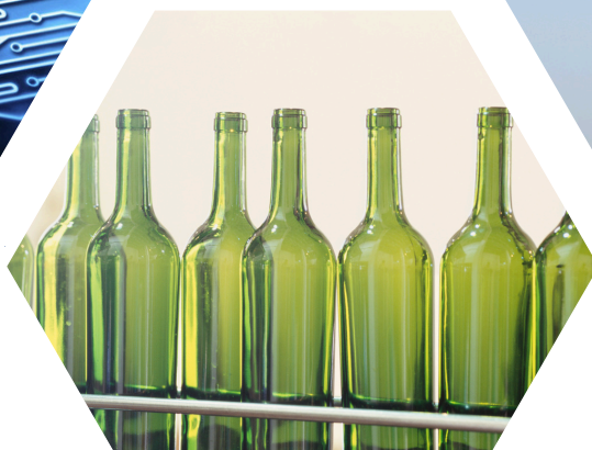
Glass industry Thủy tinh