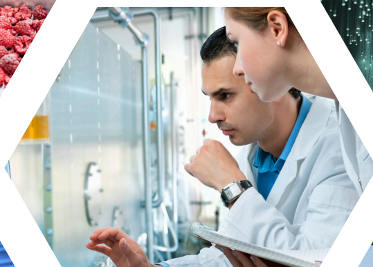
Laboratories & Research centers Phòng thí nghiệm & Trung tâm nghiên cứu