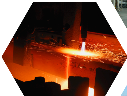
Metallurgy Luyện kim