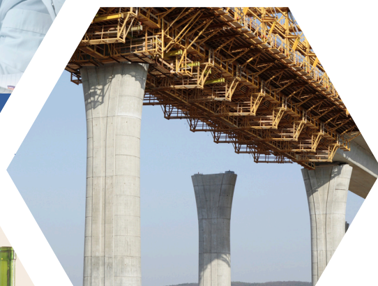
Construction, Shipyards Xây Dựng, Đóng tàu