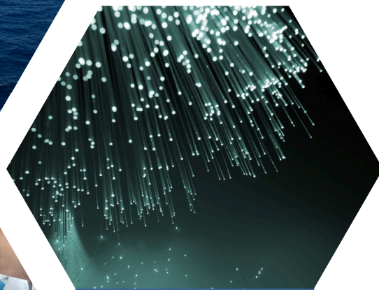
Optoelectronics Quang điện